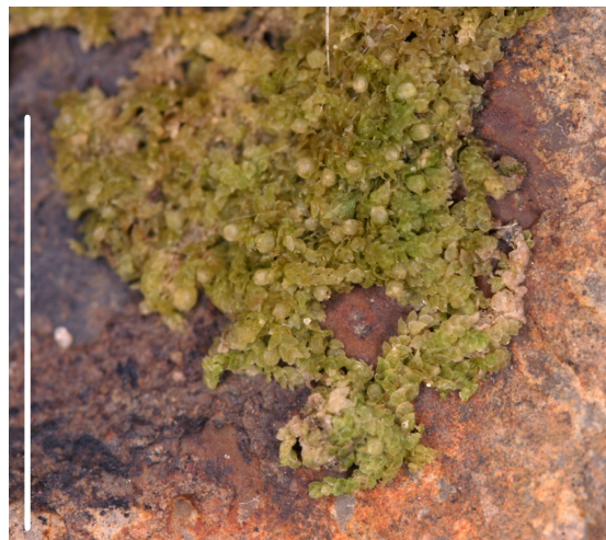
Très petite hépatique à feuilles incubes triangulaires, grumeleuses et repliées sur elles-mêmes.

Très rare, une seule station à Genève, sur la rive gauche d'un affluent du Longet, près de la frontière franco-suisse, dans le Bois des Crevasses (Chancy). Espèce à surveiller. Nouvelle pour le canton par rapport au catalogue bibliographique (Cailliau & Price, 2006). Répertoriée pour la première fois dans le canton en 2005.