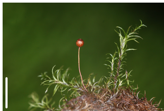
La capsule sphérique en fait une espèce facilement reconnaissable (voir confusions possibles).