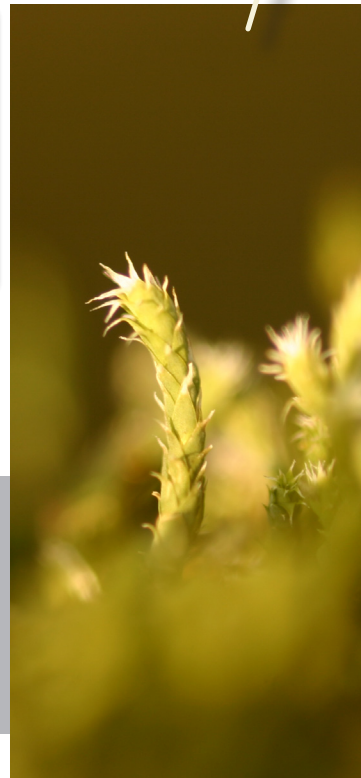
Hedwigia ciliata n'est connue que dans deux endroits à Genève. Cette espèce est facilement reconnaissable: c'est la seule espèce de notre flore à posséder des feuilles sans nervure et munies d'un poil blanc à l'extrémité (loupe!).

Surveiller l'évolution des populations des mousses intéressantes s'y développant. Eviter le «nettoyage» du bloc. Une localisation et un suivi de tous les autres gros blocs siliceux du canton se révéleraient sûrement intéressants.