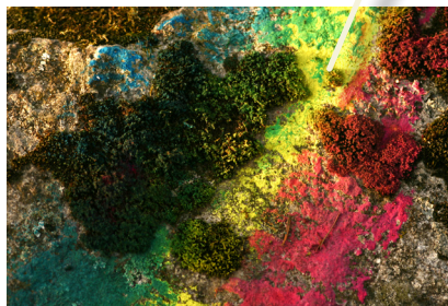
La seule station connue dans le canton de Grimmia laevigata est... taguée. Cette espèce, qui affectionne les roches siliceuses est en Suisse principalement présente en Valais et au Tessin.

La destruction de l'habitat et les «nettoyages» éventuels du bloc. Les petites escalades enfantines du blocs ne sont pas en cause.