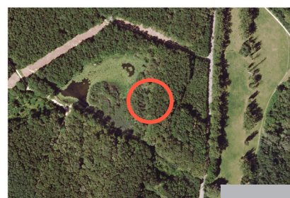
Localisation sur l'étang de la population de Riccia fluitans .

Protéger les populations actuelle de Riccia fluitans (voir la carte de localisation). Ce marais est une réserve biologique forestière protégée par l'Etat de Genève.