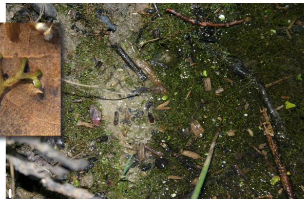
Forme aquatique de Riccia fluitans flottant à la surface de l'eau.