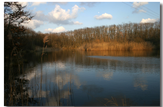
Etang du bois des mouilles.

L'étang du bois des Mouilles compte une population de Riccia fluitans , une espèce vulnérable [VU, D2] dépendante de la protection des biotopes marécageux et des zones alluviales. Cette hépatique aquatique flotte à la surface de l'étang parmi les lentilles d'eau ( Lemna sp. ) et sa forme terrestre a été vue sur le sol des berges en 2005.