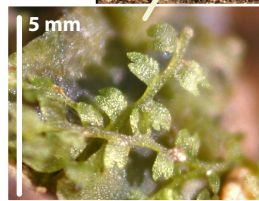
5 mm Leiocolea turbinata [EN, D2] est une espèce particulièrement rare en Suisse