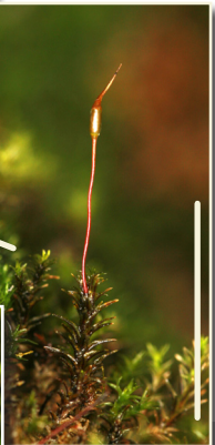
Didymodon tophaceus [NT, D2] croît à la base de la tuffière, sur la droite. Une seule population recensée depuis 2001 à Genève.

Les parois tufeuses peuvent parfois être recouvertes d' Eucladium verticillatum , une espèce également fréquente sur les conglomérats morainiques de la région.